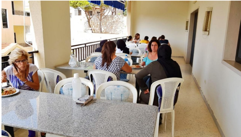
(hier beim Mittagessen auf dem Balkon)

Am zwanzigsten Tag, Mittwoch, den 23.09.2020 empfangen wir die erste Gruppe von insgesamt 14 Frauen im Dar Assalam, die wir für die nächsten Wochen bzw. Monate in unserer Begegnungsstätte beherbergen werden.